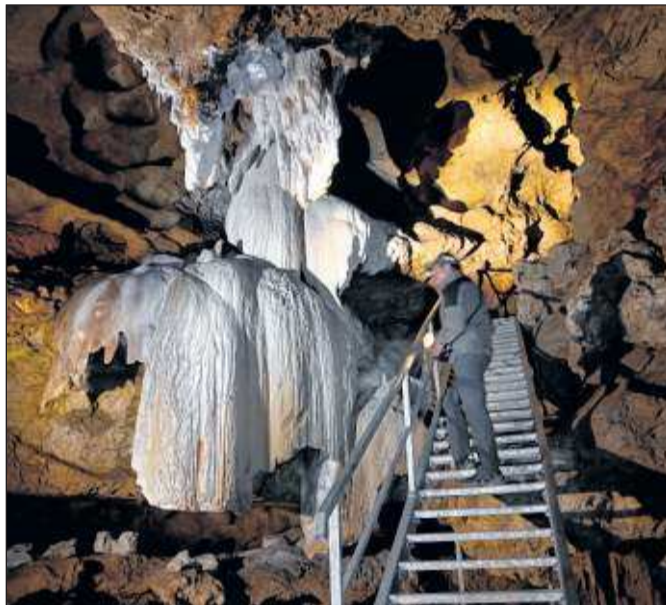
Zu Stein gewordener Wasserfall in der Kraushöhle

Fünf Grad Celsius ist schon recht frisch, aber es geht noch kälter. Auf 1641 Meter Seehöhe, im Salzburger Tennengebirge, stehen wir am Portal zu einer fröstelnd bezaubernden Welt. Es ist früher Morgen, eine dicke Nebeldecke hüllt das Tal unter uns ein. Wie ein riesiger Schlund tut sich der Eingang zur größten Eishöhle der Welt, der Eisriesenwelt, auf, die uns mit muntermachenden null Grad und einer gehörigen Portion Gegenwind empfängt. Noch bläst's – von höher gelegenen Öffnungen kommend – beim Eingang raus, bald wird sich der Luftstrom umkehren. „Klirrend kalte Luft kühlt im Winter den vorderen